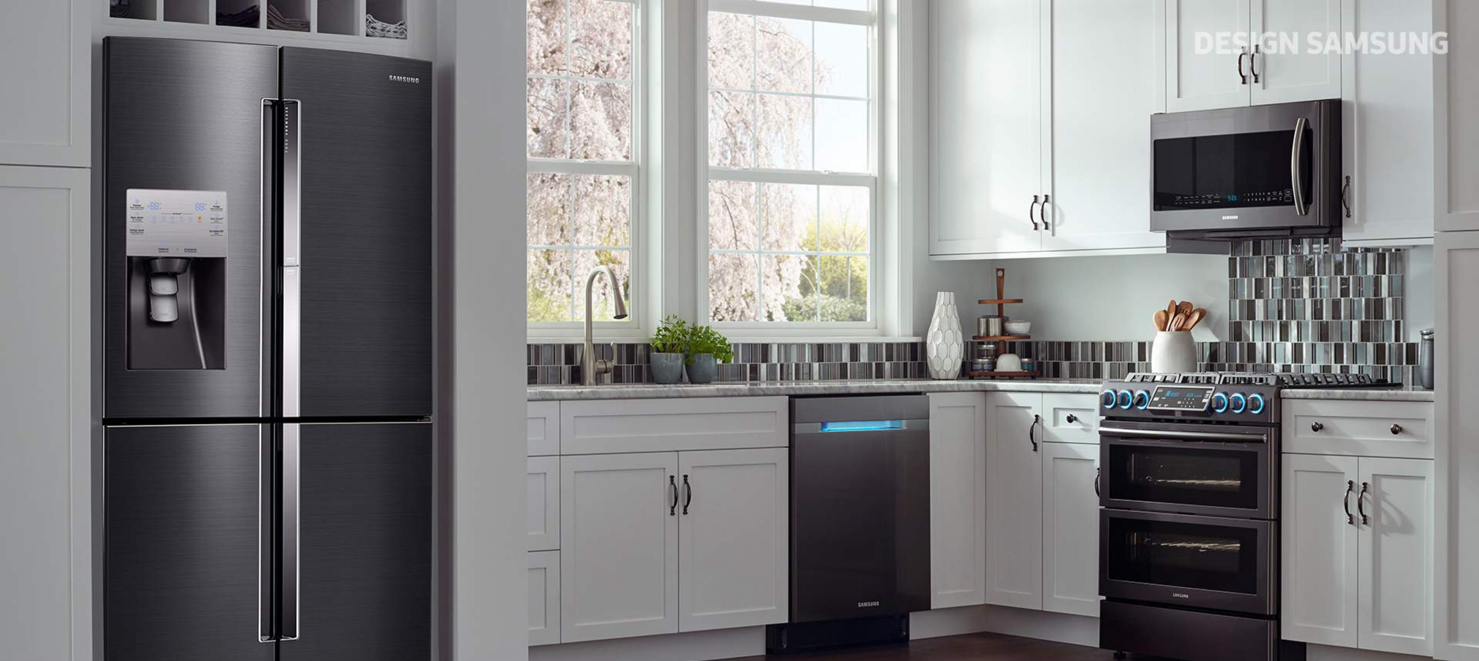
Free Standing Package