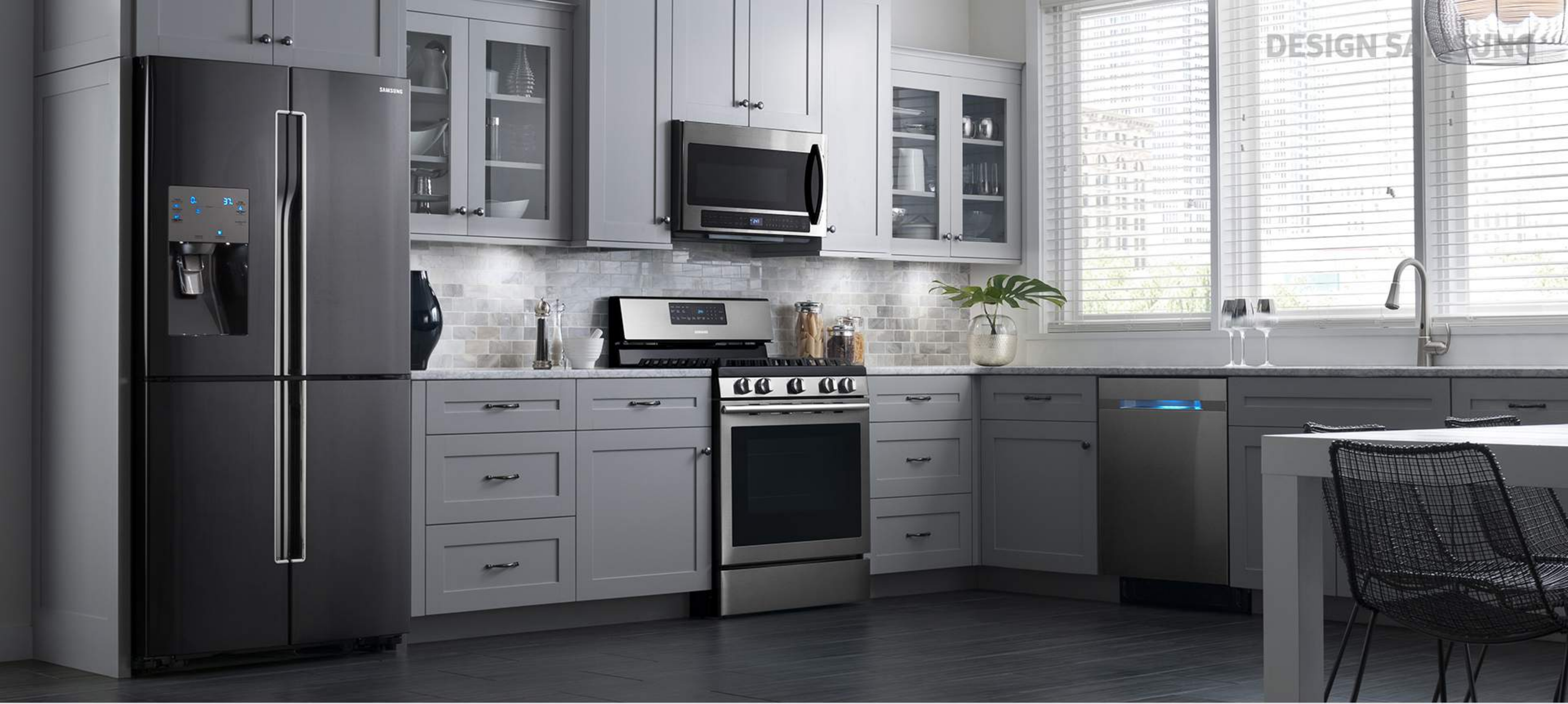
Free Standing Package